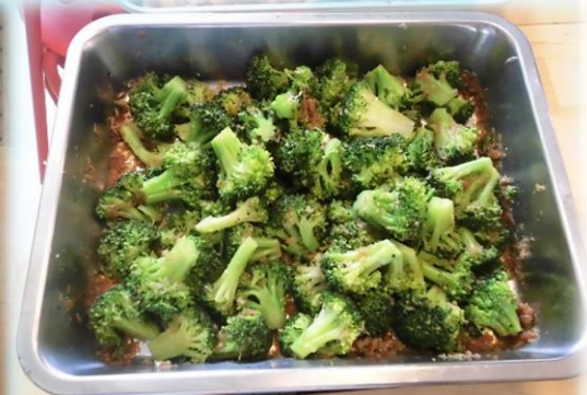
ブロッコリーおかかあえ