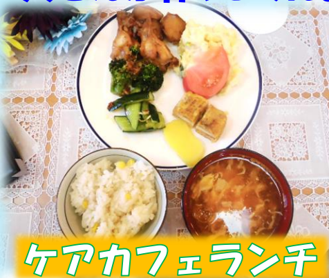
ケアカフェランチ