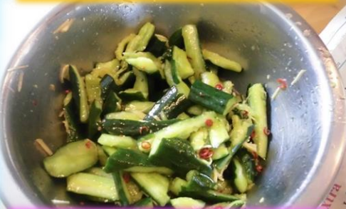
きゅうりのごま油